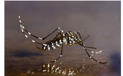
Imagen de Aedes albopictus (mosquito tigre asiático)