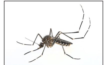
Imagen de Aedes aegypti (mosquito de la fiebre amarilla)