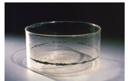
Fotos de Aedes aegypti los huevos del mosquito